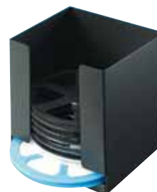
réf. DK 180 code 49003 dim. int. L x l x H : 182 x 169 x 190 mm dim. ext. L x l x H : 186 x 173 x 210 mm • pour bobines jusqu'à 180 mm