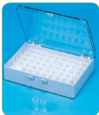
réf. V11-60 code 43401 dim. int. 120 x 161 x H29 mm • contenance 60 boîtes V4-1