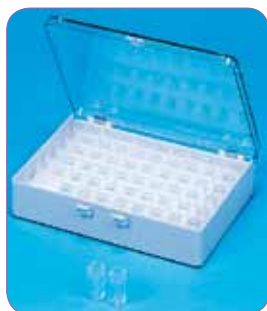
réf. V11-60 code 43401 dim. int. L x l x H : 120 x 161 x 29 mm • contenance 60 boîtes V4-1