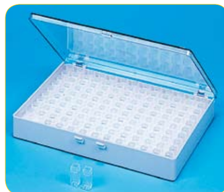
réf. V11-130 code 43402 dim. int. 168 x 228 x H29 mm • contenance 130 boîtes V4-1