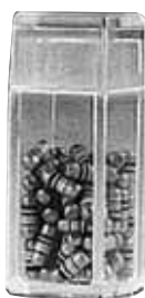
réf. V4-1 code 43403 dim. int. L x l x H : 6 x 6 x 19 mm