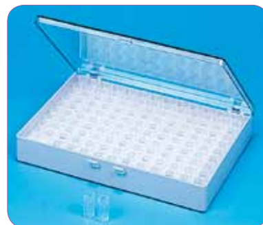
réf. V11-130 code 43402 dim. int. L x l x H : 168 x 228 x 29 mm • contenance 130 boîtes V4-1