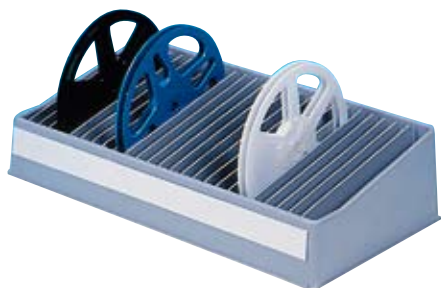
réf. RB 180 code 49001 dim. ext. 450 x 240 mm • avec 25 séparations amovibles • pour bobines de 180 ou 250 mm