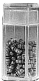
réf. V4-1 code 43403 dim. Int. 6 x 6 x H19 mm