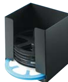
réf. DK 180 code 49003 dim. int. 182 x 169 x H190 mm dim. ext. 186 x 173 x H210 mm • pour bobines jusqu'à 180 mm