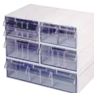
réf. BLOC TBS code 12109

Bloc standard composé de 5 TBS (2C, 1A, 1B et 1D) soit 7 tiroirs avec séparations amovibles pour un volume total de 7700 cm 3 . Peut se poser, être vissé au mur ou même suspendu à une étagère. dim. ext. (en mm) : L 182 x l 263 x H 222