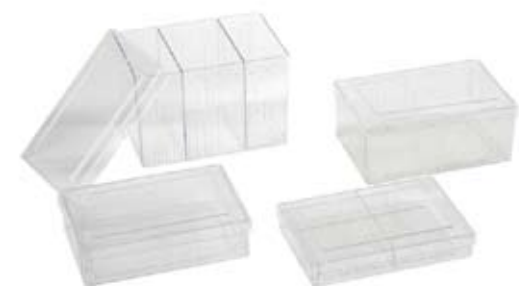
réf. A500/20 code 42201 122 x 82 x H22