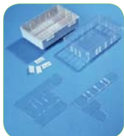
réf. A6/40 code 42151 178 x 117 x H48

Les séparations sont fournies en plus sur demande. Les séparations longitudinales et transversales se croisent et permettent de très nombreuses combinaisons. Les dimensions sont indiquées hors tout, en mm. Chaque modèle des boîtes MINIMAX peut être livré, en séries moyennes et grandes dans la couleur de votre choix. Nous consulter.