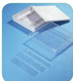
réf. A400 code 42412 296 x 268 x H60