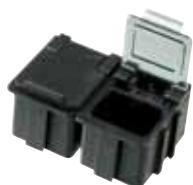
réf. NB1K dim. ext. L x l x H : 22 x 30 x 21 mm