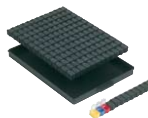
réf. 144 NB1