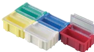
réf. NB-2 CT dim. ext. 43x30xH21 mm