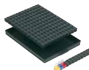
réf. 144 NB1