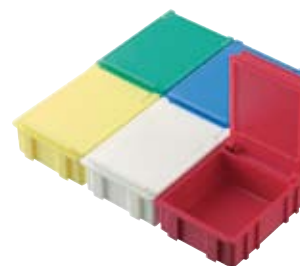
réf. NB-3 dim. ext. 43x58xH21 mm