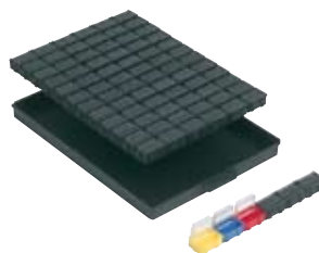
réf. 72 NB2