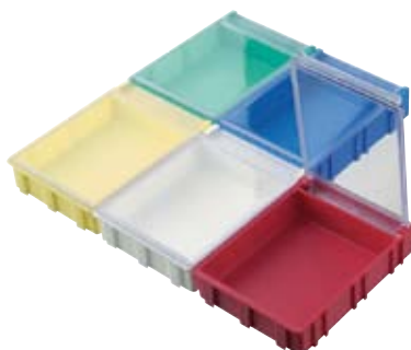
réf. NB-4 CT dim. ext. 63x86xH21 mm