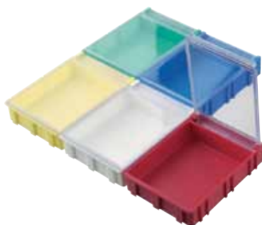
réf. NB-4 CT dim. ext. L x l x H : 63 x 86 x 21 mm