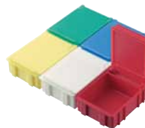
réf. NB-3 dim. ext. L x l x H : 43 x 58 x 21 mm