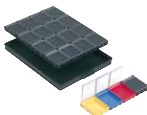
réf. 16 NB4