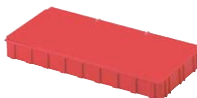
réf. NB-5 dim. ext. 186x86xH21 mm