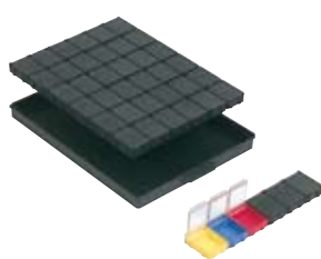
réf. 36 N63