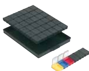
réf. 36 NB3