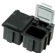
réf. NB1K dim. ext. 22x30xH21 mm