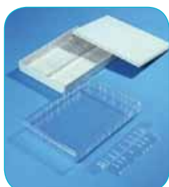
réf. A4/40 code 42109 L x l x H : 315 x 230 x 48 mm