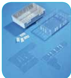
réf. A6/40 code 42151 L x l x H : 178 x 117 x 48 mm

Boîtes minimax, séparables et empilables. Tous les modèles sont disponibles sur stock en polystyrène cristal transparent et sur demande en polystyrène gris opaque. Les séparations sont fournies en plus sur demande. Les séparations longitudinales et transversales se croisent et permettent de très nombreuses combinaisons. Les dimensions sont indiquées hors tout, en mm. Chaque modèle des boîtes MINIMAX peut être livré, en séries moyennes et grandes dans la couleur de votre choix. Nous consulter.