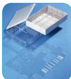
réf. A4/60 code 42113 L x l x H : 315 x 230 x 72 mm