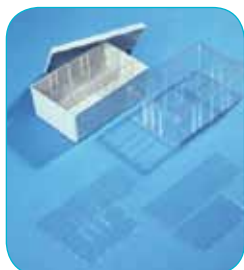
réf. A6/60 code 42159 L x l x H : 178 x 117 x 72 mm