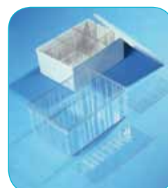
réf. A4/120 code 42101 L x l x H : 315 x 230 x 132 mm