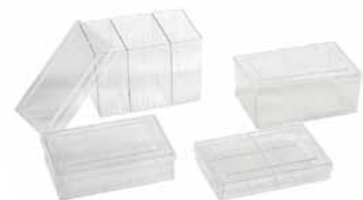
réf. A500/20 code 42201 L x l x H : 122 x 82 x 22 mm