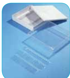
réf. A400 code 42412 L x l x H : 296 x 268 x 60 mm