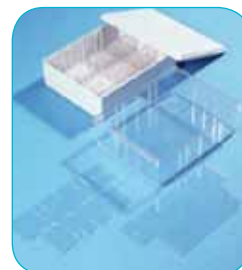
réf. A5/60 code 42135 L x l x H : 228 x 178 x 72 mm